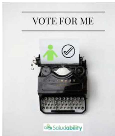
Ejemplo de alguna entrada del blog de redessocialesfarmacia.com elaborada con imágenes de Canva

La imagen es lo que transmites así que si eres un pésimo fotógrafo, compra imágenes y añádeles texto atractivo. O contrata a un fotógrafo para que te saque una tirada de X fotos de producto para tu blog. ¡Seguro que tienes algún estudiante de diseño cerca!